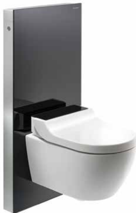
↑ Сантехнический модуль Geberit Monolith