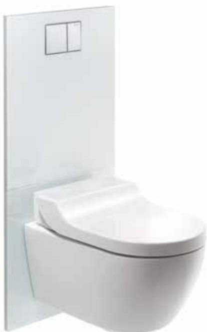
↑ Декоративная панель Geberit AquaClean

Если у стены уже установлен наружный смывной бачок или же встраивание бачка в стену не представляется возможным в связи с отсутствием времени, бюджетом или конструкцией здания, прекрасной альтернативой послужит сантехнический модуль Geberit Monolith. Ультратонкий смывной бачок и вся необходимая арматура скрываются за элегантной стеклянной стенкой. Конструкция Monolith быстро устанавливается и легко подключается к имеющимся водопроводным и канализационным соединениям.